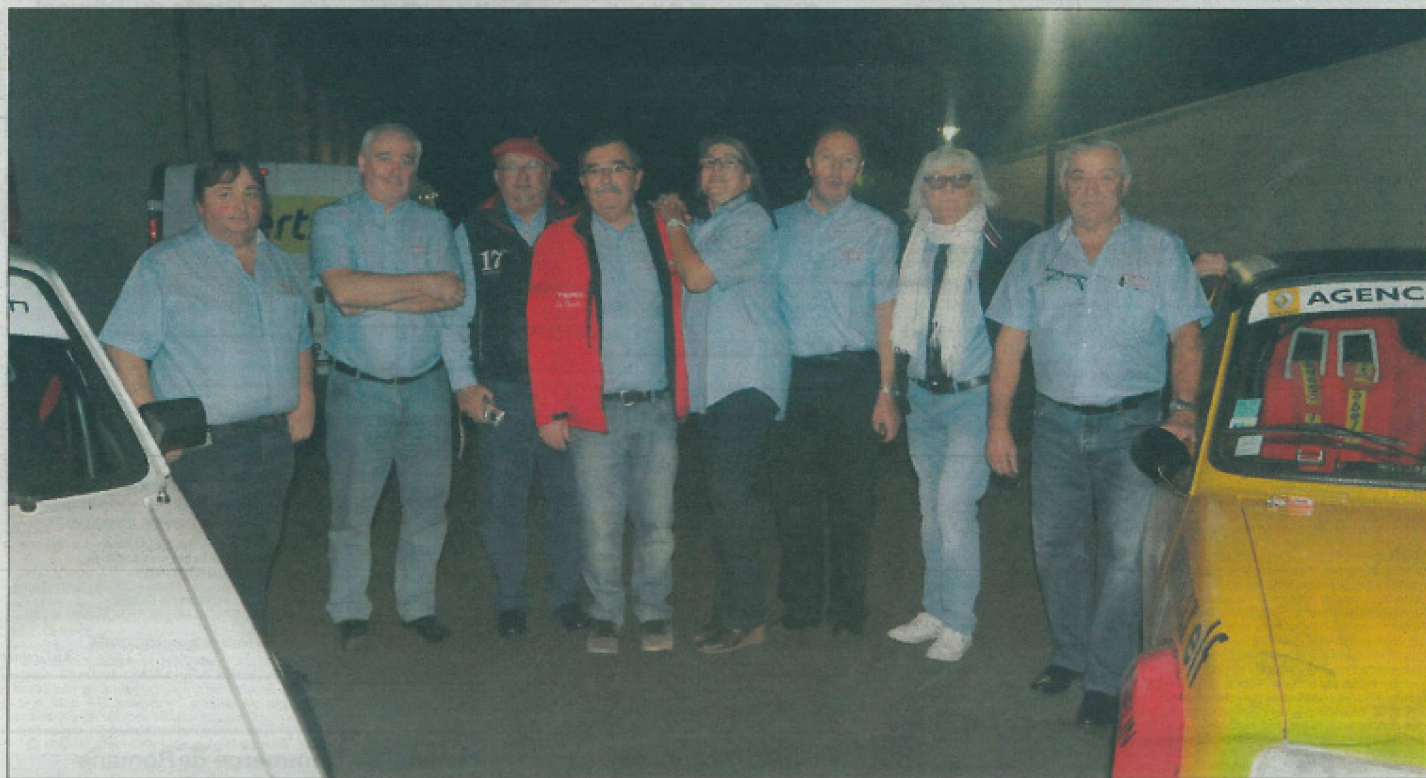
Une partie des équipages qui sera au départ du prochain rallye historique Monte-Carlo