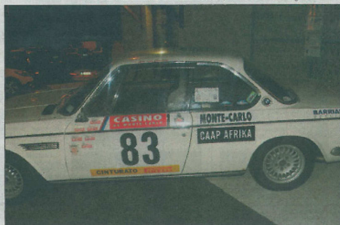
La BMW 200 Ti