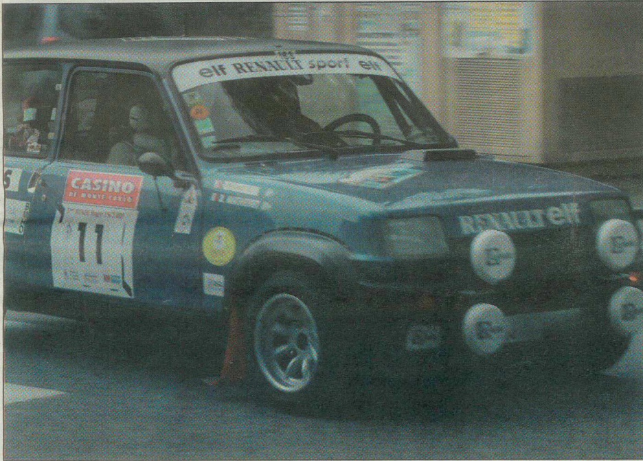
11 zones de régularité sont programmées pour cette 8 e Ronde Roger Usclard.

Plus de 70 concurrents participent à la 8 e Ronde Roger Usclard organisée les 21 et 22 mai. 11 zones de régularité sont programmées pour 450 km (Spéciales et liaisons). Premier rassemblement, samedi 21 mai à 13h30 à la plage nautique de Saint-Nazaire-en-Royans. Les participants emprunteront les routes mythiques du Monte-Carlo et se dirigeront vers le Sud de notre département, pour revenir en fin de soirée à Saint-Nazaire-en-Royans. p 36/37