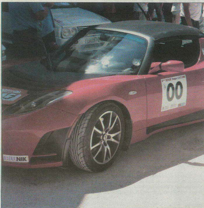
Cette 8 e ronde s'annonce passionnante pour les équipes engagées.