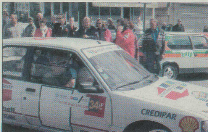
Plus de 70 équipages inscrits...

...C'est une épreuve automobile où les concurrents évoluent sur route, généralement ouverte, et respectent le code de la route. Il n'y est pas question de vitesse de pointe mais plutôt de vitesse moyenne et de navigation ; l'attention étant portée sur la régularité. Une moyenne de vitesse est donc imposée aux concurrents.