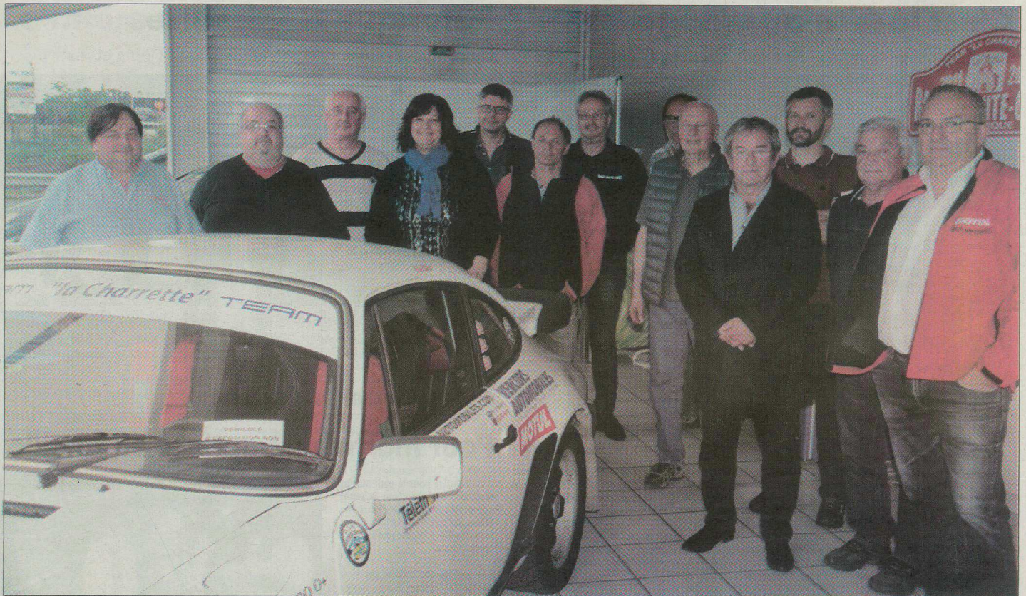
Le Team La Charrette a su rendre incontournable la Ronde Usclard.